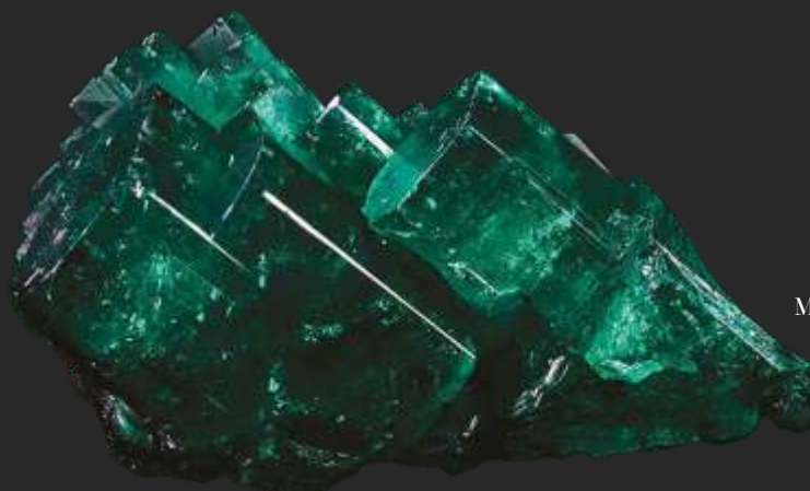
Macla Museo Internacional de la Esmeralda