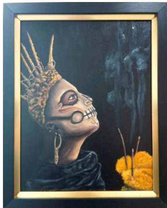
Título: Katrina Técnica: Oleo sobre Lienzo Tamaño 31 x 43 cms

Estas obras se expusieron en Stamford (USA) y consulado de Paris y la XIII bienal Internacional Suba Sala de arte Biblioteca Virgilio Barco, Bogotá Colombia. y próximamente artista invitado al desfile de la colombianidad en New York.