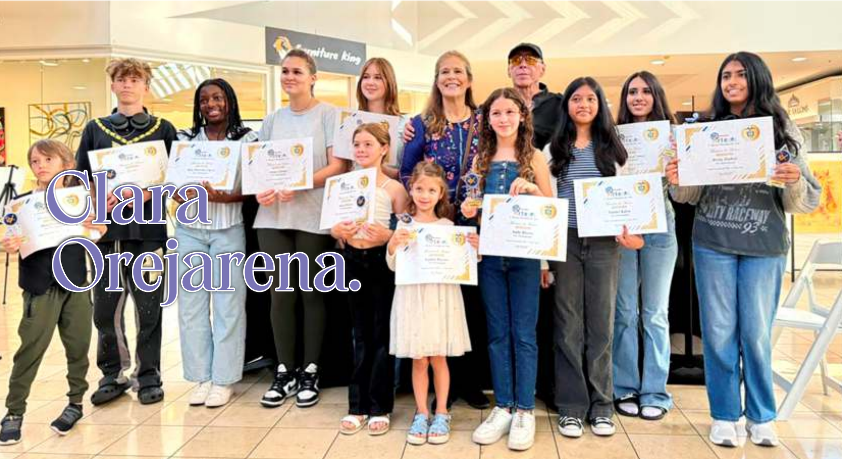
En su taller de diseño