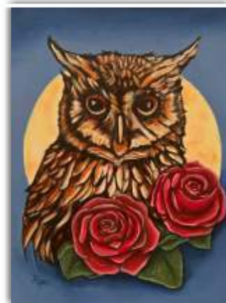
De la serie Fauna Oleo sobre lienzo