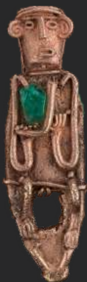
Figuras Precolombina Muisca oro y esmeralda. Museo del oro