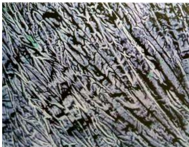
Lavanda Catalina Acosta Zamudio 35 x 45 cms. Acrilico sobre Lienzo